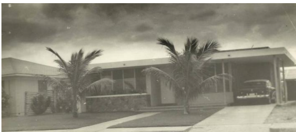
Figura 1. La imagen urbana de Urdesa en sus inicios año 1954.

Nota: Registro fotográfico histórico de Guayaquil (2020)