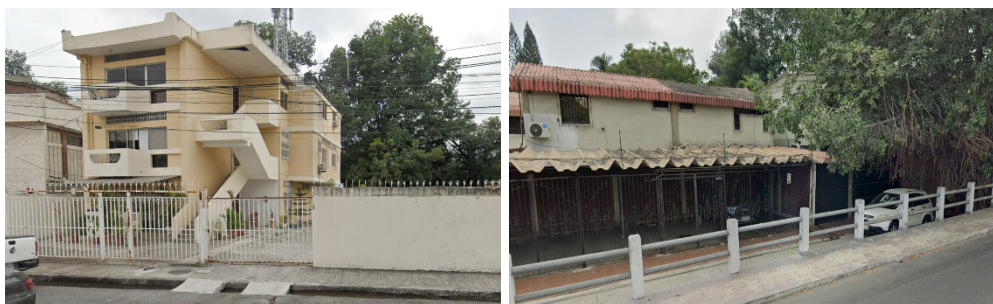
Figura 5. Modelos de vivienda en contacto con el manglar en Urdesa.

Nota: Basado en el análisis in situ de los autores en el Barrio Urdesa (2025)