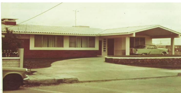
Figura 2. La imagen urbana de Urdesa de la década de los 70's.

Nota: Registro fotográfico histórico de Guayaquil (2020)