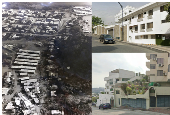
Figura 4. Influencia de los elementos naturales en el diseño de las viviendas de Lomas de Urdesa.

Nota: Registro fotográfico histórico de Guayaquil (2020)