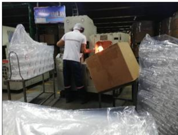
Imagen N1. Operador proforma

Al aplicar el método REBA en las actividades de operador proforma y operador logística nos demostró los siguientes resultados: Operador proforma, nivel de riesgo ergonómico según metodología REBA.